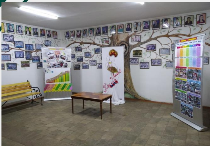
Дерево роду школи